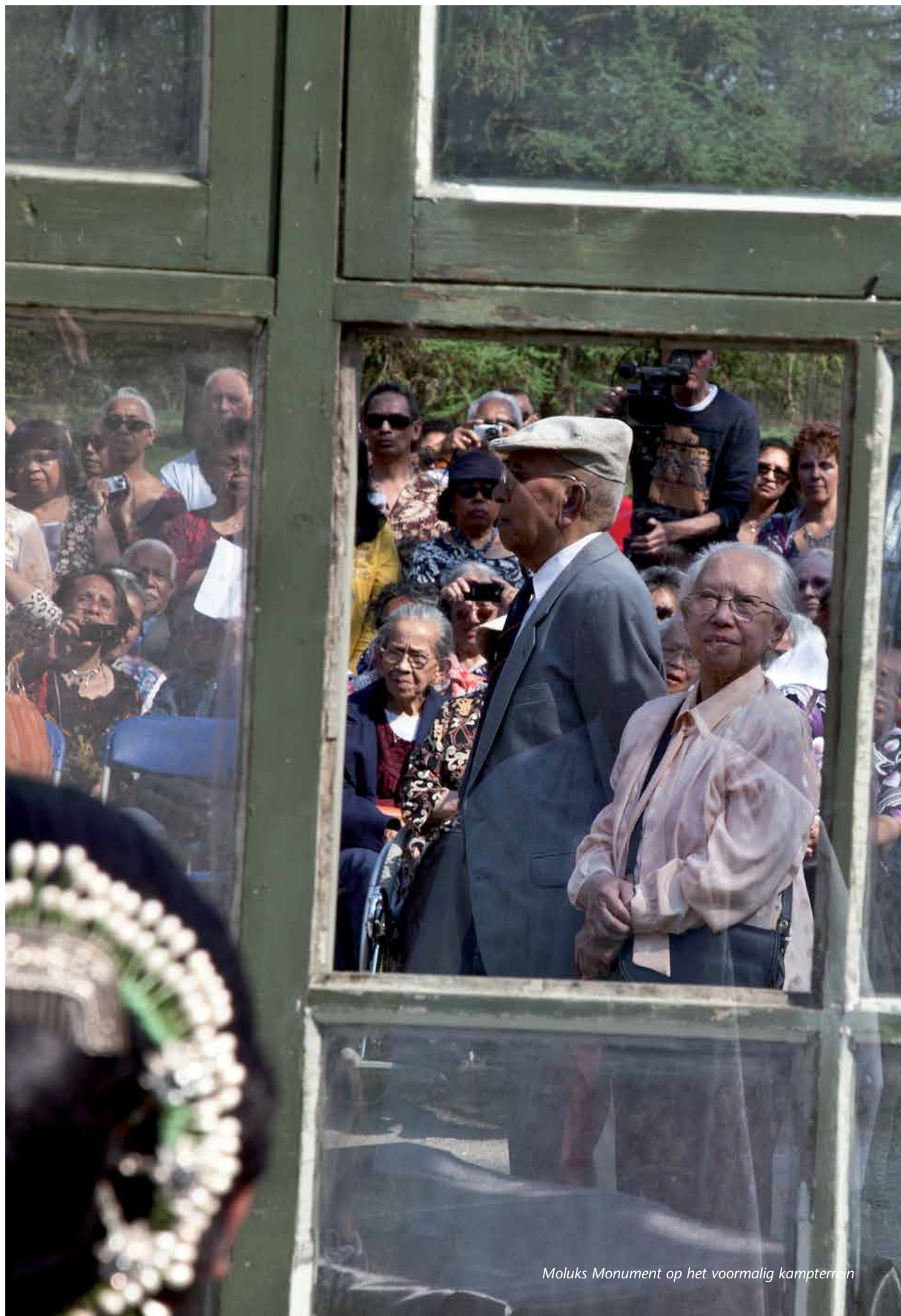
Moluks Monument op het voormalig kampterrein