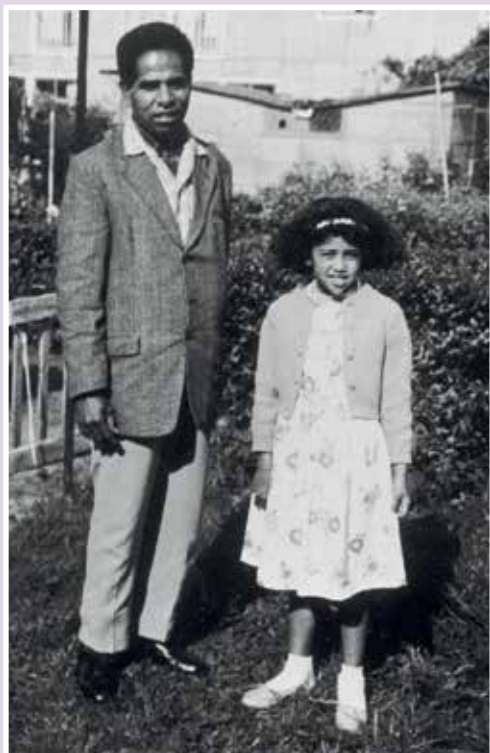
Orpa met haar vader in de tuin van het gastgezin in Emmen

Ik ben in Schattenberg geboren, kamp Westerbork, dan schrikt iedereen. De mensen denken dan aan de nare tijd met de Joden. En dan zeg ik er vaak achteraan: 'Ik heb er een hele fijne jeugd gehad als Ambonese toen'. Dan is de reactie van de Nederlanders vaak: 'In die barakken, in dat kamp. Dat hadden ze niet kunnen maken. Dat mensen daar moesten wonen!'