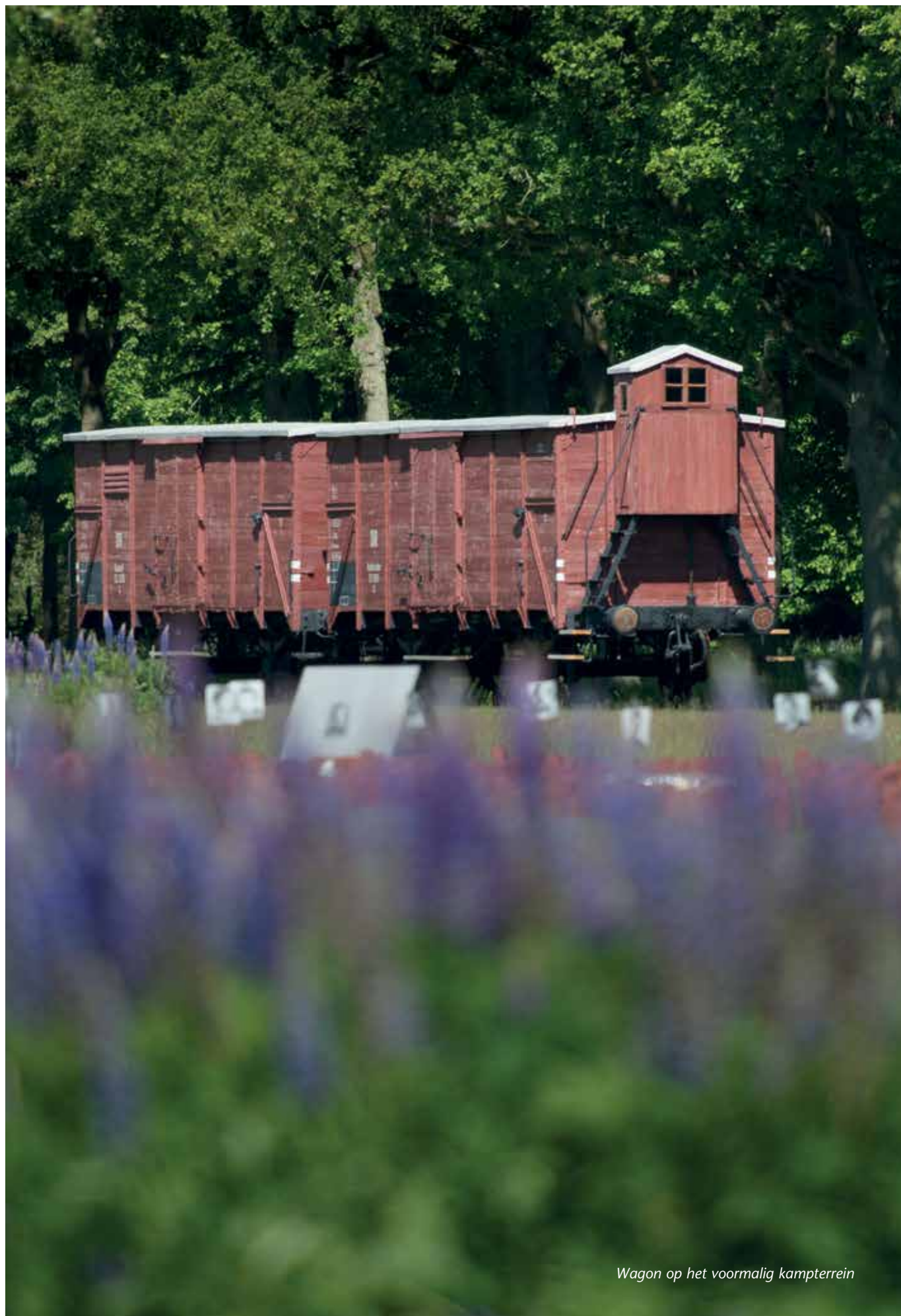
Wagon op het voormalig kampterrein