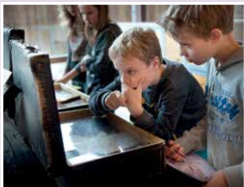
Leerlingen bezoeken tentoonstelling in Herinneringscentrum Kamp Westerbork