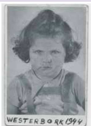
Lous in Kamp Westerbork

Ik ben geboren op 16 mei 1941 en ik ben Joods.