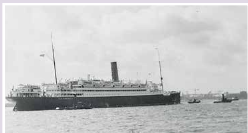
Overtocht naar Nederland aan boord van het schip Atlantis

– Geboren aan boord van het schip Atlantis op weg van Indonesië naar Nederland, 22 maart 1951