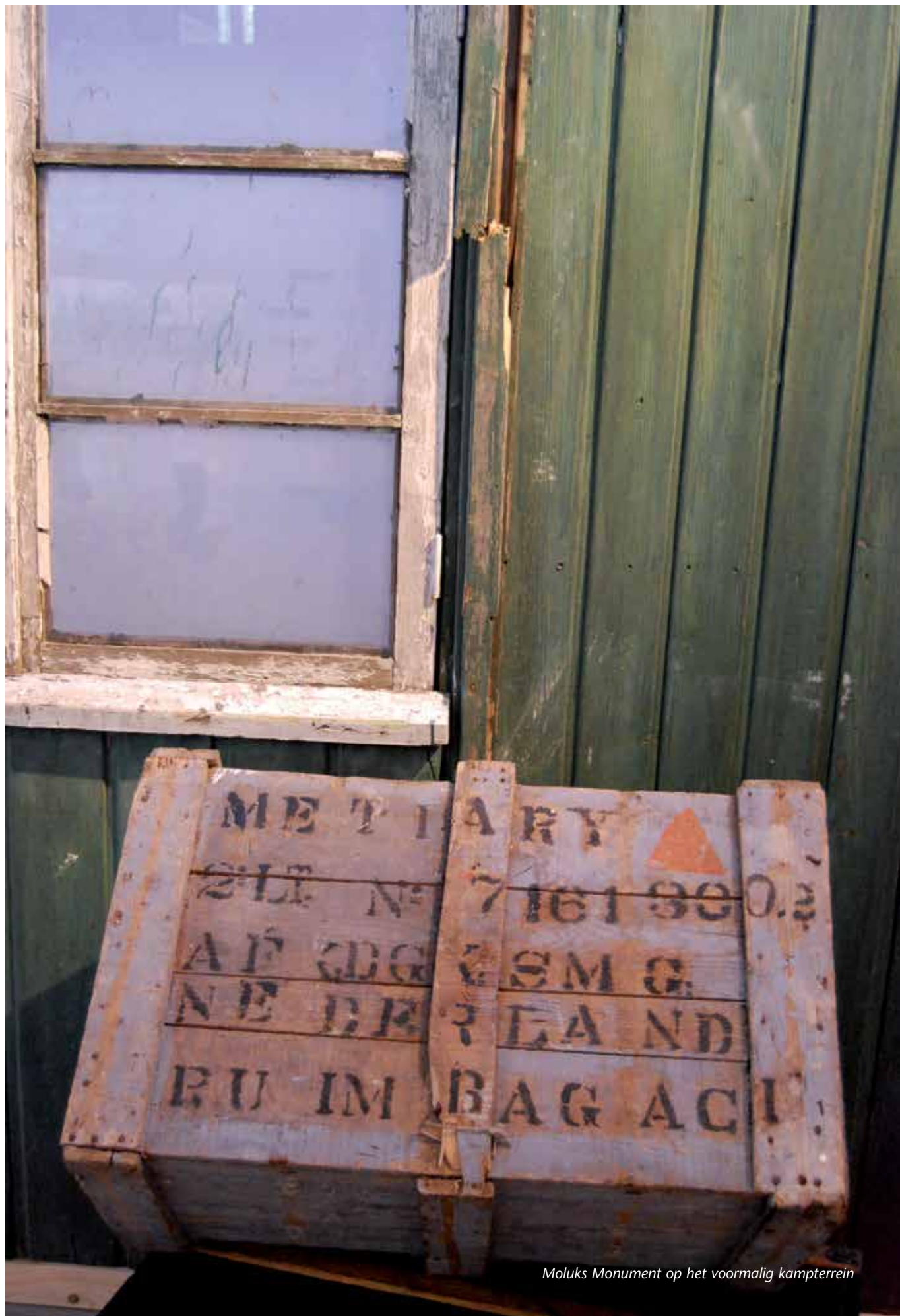
Moluks Monument op het voormalig kampterrein